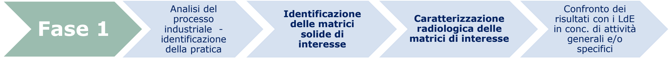
TABELLA I: MATRICI DI INTERESSE E CARATTERIZZAZIONE RADIOLOGICA (cont.)