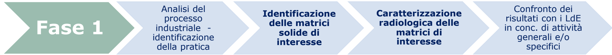
TABELLA I: MATRICI DI INTERESSE E CARATTERIZZAZIONE RADIOLOGICA