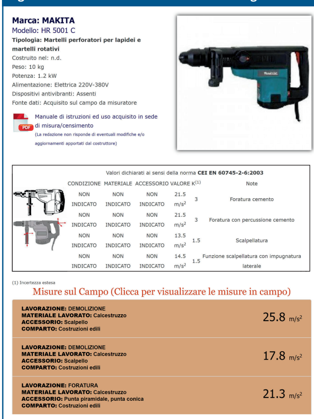
Figura 2 Scheda di una sorgente HAV